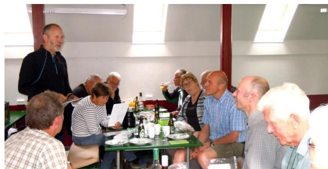
Frokost og resultatformidling