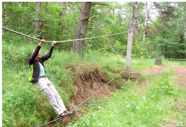
Høje Formand afprøver stridshinderbanen