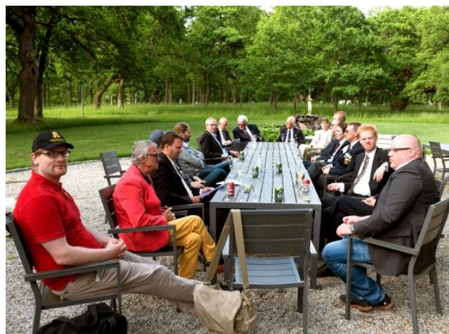
Snak før middagen i haven foran officersmessen