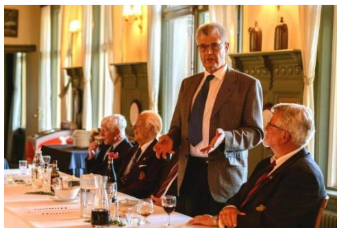
Høje Formands takketale