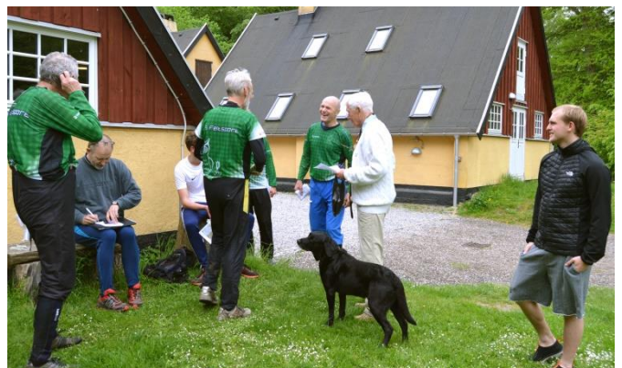
Mål og eftersnak i lejren