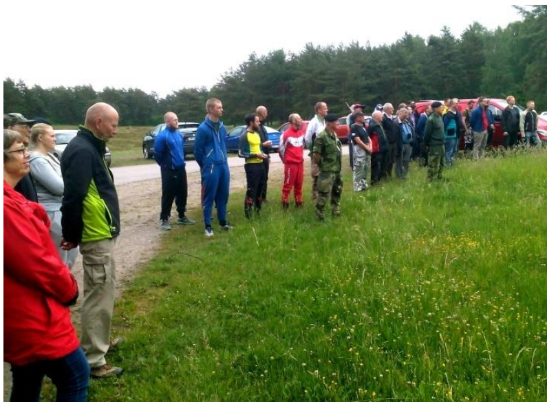
Velkomst og flaghejsning på skydebanen