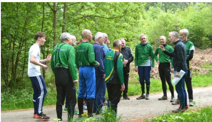
Start i skoven

På den afkortede bane var undertegnede hurtigst og satte her selveste Høje Formand med pacer til vægs. Her måtte enkelte rutinede løbere opgive at finde et par poster og kom hjem lidt slukørede ad bagvejen.